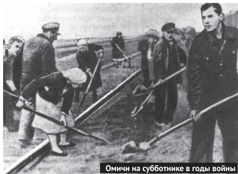
Омичи на субботнике в годы войны

КАК ОМСК ПОМОГАЛ ФРОНТУ: МАЛОИЗВЕСТНЫЕ ФАКТЫ